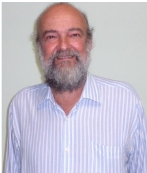
Penna, presidente do PV

Presidente nacional do Partido Verde (PV), o deputado federal José Luiz de França Penna (SP) diz que a sigla está preparada para o pleito eleitoral em 2014. Em entrevista para o Jornal Correio Paulista – edição 15/3, Penna destaca sua eleição à presidência da Comissão de Meio Ambiente da Câmara dos Deputados, cita nomes para disputar a presidência da república no ano que vem, comenta sobre as candidaturas na região Oeste de São Paulo aos cargos de deputados federal e estadual, fala da posição do PV em relação ao surgimento de novos partidos e finaliza a entrevista comentando a participação do PV nos governos Alckmin (PSDB) e Haddad (PT).