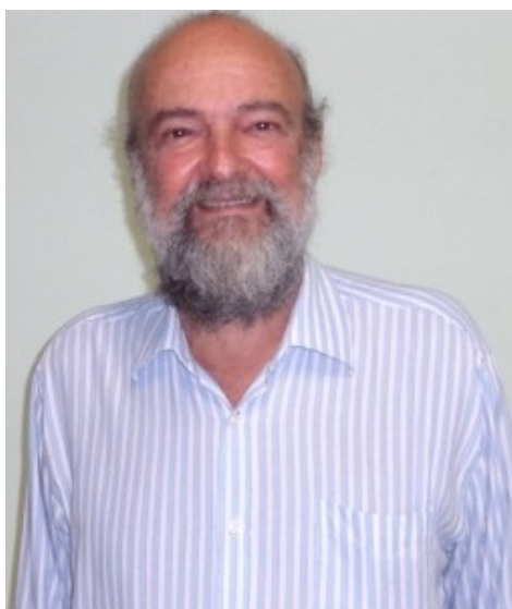
Penna, presidente do PV

Presidente nacional do Partido Verde (PV), o deputado federal José Luiz de França Penna (SP) diz que a sigla está preparada para o pleito eleitoral em 2014. Em entrevista para o Jornal Correio Paulista – edição 15/3, Penna destaca sua eleição à presidência da Comissão de Meio Ambiente da Câmara dos Deputados, cita nomes para disputar a presidência da república no ano que vem, comenta sobre as candidaturas na região Oeste de São Paulo aos cargos de deputados federal e estadual, fala da posição do PV em relação ao surgimento de novos partidos e finaliza a entrevista comentando a participação do PV nos