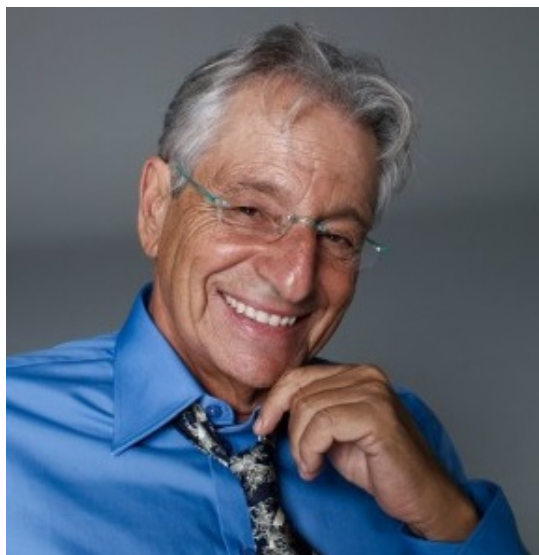
Fernando Gabeira, jornalista e escritor

É preciso lembrar que o candidato a presidente deve estar vinculado com a disputa pelo governo do Estado de São Paulo. Porém, antes de definirmos o nome para disputar a presidência da República estamos criando um programa de governo verde para o Brasil.